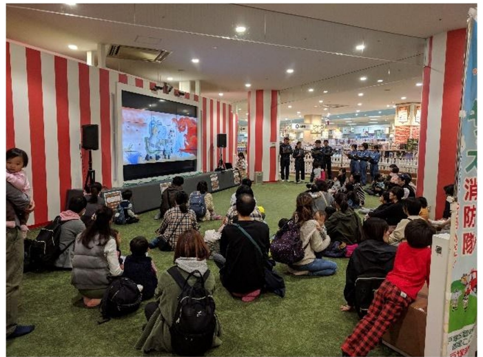
秋の火災予防運動

大スクリーンに映された絵本を背景に 横浜市消防音楽隊による朗読と演奏 (2020年1月)