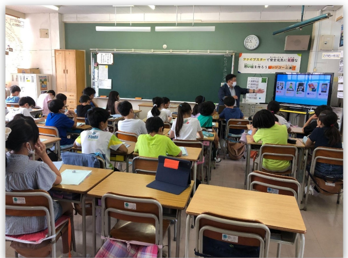
アプリ開発者によるプログラミング授業