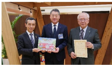
令和元年度 チーム横浜表彰