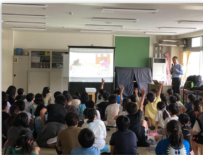
消防のOBによる防災授業